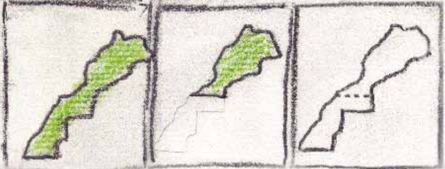
Le Maroc Selon le Maroc.